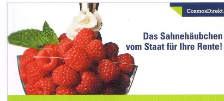
Produktflyer 2, Vorderseite