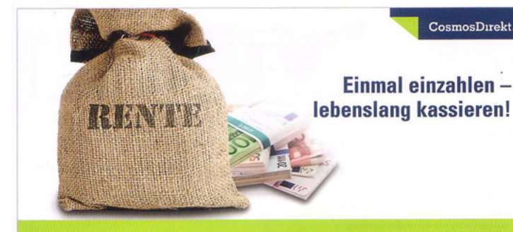
Produktflyer 4, Vorderseite