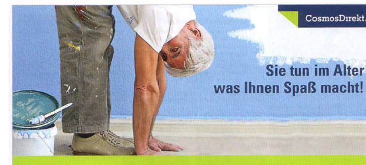
Produktflyer 3, Vorderseite